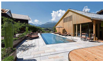
Das Oswalda Hus setzt auf Natürlichkeit und Genuss. 4/19

Einmalige Weltblicke, Natürlichkeit, inspirierendes Design: das ist das Bio-Hotel Oswalda Hus in Riezlem. Nur zwölf Doppelpzimmer und zehn Holz-Suiten gibt es in dem unvergleichlichen Hideaway.